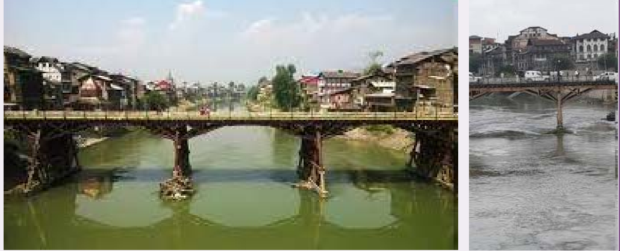
એક સમયે પરિવહન માટે નાની-નાની મીની બસો શ્રીનગરમાં શરૂ થઈ ત્યારે હબ્બા કાદલ વિસ્તારના કશ્મીરી ભાષાના સંવાદોના અવાજો

રાજબાઈ બચશા .... હે બાબુજી બચશા .... હે સુસા ..... હે જોગરા લોભ ખુશા.... હે ખ્વાજા સાહબ ... હતા એ બની .... ઓ રેડા હતા સાચકલ ઓછા પોષા શાહ બચો બચો You queen like women save yourself you.... Pandit Ji save yourself.... My lungs like dear pedestrian!!!! My liver like dear traveller .... mou acid you Khwaja Saheb ji.... you sister are you