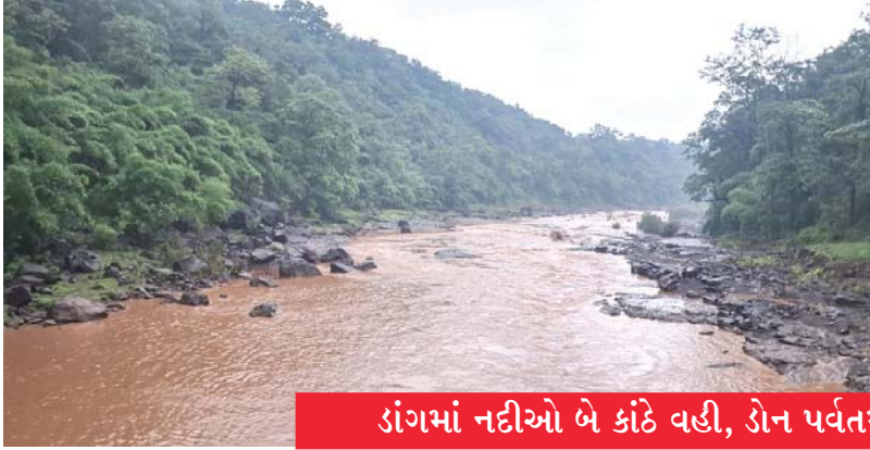
ડાંગમાં નદીઓ બે કાંઠે વહી, ડોન પર્વતમાં ભેખડો ધસી પડી