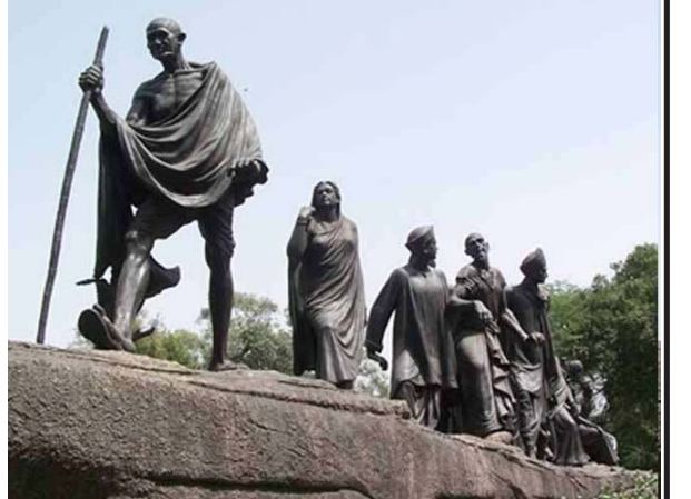
પ્રતિનિધિ ચૂંટી શકે. (પૃ.૩૨) ★ આઝાદીના આટલા વર્ષો પછી ગંભીર મંદીનું વાતાવરણ, ઘટતી આવક, કથળતું સ્વાસ્થ્ય, વધતા જતા ભાવો, ઘટતું ઉત્પાદન, ગંભીર બેકારી અને બેરોજગારી નવા નવા લોકોનો, બેંકોના દેવાળા, શેરબજારમાં બેફામ લૂંટ, યુ.ટી.આઈ.ના ગોટાળા, ભારતની નિર્દોષ નિહલ્લાહી પ્રજા સહન કરતી આવી છે. ને સહન કરી રહી છે. હવે તો હદ થાય છે. ક્યાં સુધી ઘેટા ઘેટાં જ રહેશે, ને વરુઓ મજા કરશે? સરકારના કાલા વચનોને અર્થદેહિના અભાવની હવે હદ થાય છે. (પૃ.૩૮)