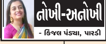
તોખી-અતોખી - કિજલ પંડ્યા, પારડી

રાખી શક્યા ન જેને કદી નિજ નિવાસમાં! સચવાય છે એ પિતૃ હવે કાગવાસમાં. (- અગમ)