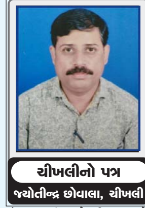
ચીખલીનો પત્ર જયોતીબંદ છોવાલા, ચીખલી

ને.હા નંબર ૪૮ ઉપર હાઈવે ઓથોરિટી દ્વારા હાઈવે રોડ અને સર્વિસ રોડ વચ્ચે પાણીના નિકાલ માટે ગટર વ્યવસ્થા કરવામાં આવી રહી છે આ ગટર વ્યવસ્થાને કારણે ચોમાસા દરમિયાન રોડ ઉપર ભરાઈ રહેતું વરસાદી પાણી ગટરમાં વહી જાય અને રોડ ઉપર પાણી જમા ન થતા વાહન ચાલકોને કોઈ મુશ્કેલીમાં ન મુકતું પડે પરંતુ આ ગટર વ્યવસ્થાને કારણે હાઈવે ઉપર ધમધમતા હોટલ અને ધાબા સંચાલકોને મોટો ફટકો પડી રહ્યો છે. હોટલના કમ્પાઉન્ડમાં ભારે વાહનો ઉભા રાખી વાહન ચાલકો જમીને થોડા કલાકો આરામ કરતા હોય છે પરંતુ આ ગટર બનતા જ ભારે વાહનો આ ગટર ઉપરથી પસાર કરવામાં આવે તો ગટરના ડાંકણા તૂટી જવાની પરિસ્થિતિનું સર્જાઈ રહી છે અને જે તે હોટલના આગળ ગટરના ડાંકણા તૂટેલ રહેશે તો જે તે હોટલના સંચાલકને હાઈવે ઓથોરિટી દ્વારા ફટકારવાની ચેતવણી આપતા હોટલ અને ધાબા સંચાલકોમાં ભારે કચવાટ જોવા મળી રહ્યો છે.