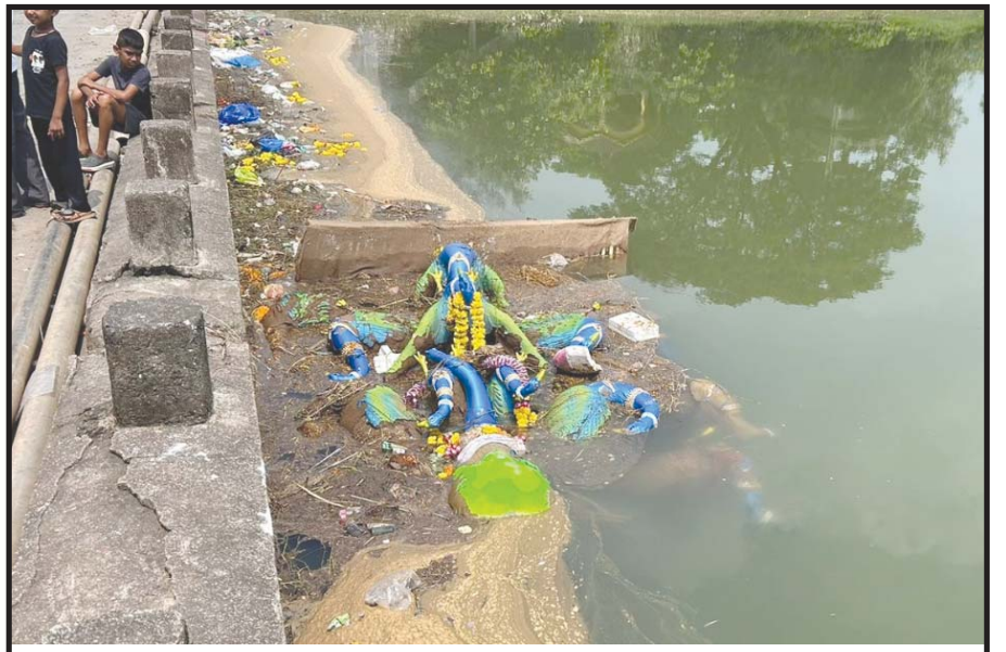
ચીખલીમાં વિસર્જત મૂર્તિ રડળી

અભાવના કારણે હોસ્પિટલમાં આવતા જોવા મળી રહ્યા છે. હોસ્પિટલના ઈમરજન્સી વોર્ડ તેમજ ગેલેરી અને હોસ્પિટલ કમ્પાઉન્ડમાં રખડતા થાનોના કારણે હોસ્પિટલમાં સારવાર લઈ રહેલા દર્દીઓ અને સ્વજનો સાથે રહેતા હોય છે અને આ સ્વજનો હોસ્પિટલની ગેલેરીમાં નીચે કે બાકડા, પુરશી ઉપર ઊંધી જતા હોય છે. જોકે આ રખડતા થાનો અચાનક આવી ચડતા હોય છે જેથી દર્દી અને તેના સ્વજનો ડરી જતા હોય છે. સિવિલ હોસ્પિટલમાં સ્થાન આવી જવાના મામલે હોસ્પિટલ દ્વારા આ ઘટનાને ગંભીરતા લઈ સિક્કુરિટી એજન્સીને નોટિસ ફટકારવામાં આવી હોવાનું જાણવા મળ્યું છે.