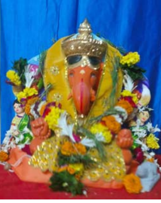
અગિયારી સ્ટ્રીટ યુવક મંડળ