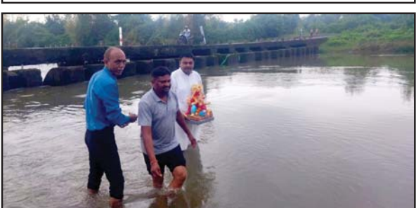
આજરોજ અઢી દિવસના ગણપતિ બાપાનું વિસર્જન કરવામાં આવ્યું હતું. વાંસદા નગરમાં અઢી દિવસના ગણપતિ ઘરે પૂજા અર્ચના કર્યા બાદ આજ રોજ નદી કિનારે ગણપતિ બાપાનું વિસર્જન કરવામાં આવ્યું.