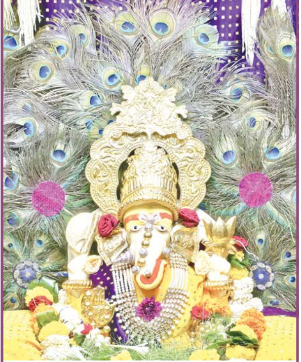
સમગ્ર પંચકમાં આસ્થાનું પ્રતિક ગણતા વલસાડના મોટા બજારના ગણપતિ મંદિરની શ્રીજી પ્રતિમાને મનોહર શણગાર કરાયો

કેન્દ્ર સરકારની કચેરીમાં ક્લાસ-૧ અને ક્લાસ-૨ જેવા ઉચ્ચ હોદ્દા અને માતબર પગાર ધરાવતાં પી.એફ. કમિશનર અને એન્ફોર્સમેન્ટ ઓફિસર એન્ટી કરપ્શન બ્યુરોના છકટામાં રંગે હાથ ઝડપાયા