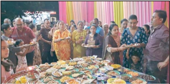
દાનહ કાપડી સમાજ દ્વારા ગણપતિ સ્થાપના કરવામાં આવી હતી. જેમાં ગણેશજીની મહા આરતીનું આયોજન કરવામાં આવ્યું હતું. તેમજ બાપાને છપ્પન ભોગ ધરાવવામાં આવ્યો હતો. મહા આરતીમાં દાનહ કાપડી સમાજના લોકોએ ઉત્સાહ પૂર્વક ભાગ લીધો હતો.

પારડી, તા.૦૮ : પારડી પંચકમાં સ્થાપિત કરવામાં આવેલા અઢી દિવસના શ્રીજીની ૧૫૦થી વધુ પ્રતિમાઓનું આજરોજ પારડી પાર નદીમાં માંગેલા લાઈફ સેવર ટ્રસ્ટના સાહસિક યુવાનોએ વિસર્જિત કર્યાં હતાં. પારડી પંચકમાં આવેલ સોસાયટીઓમાં અને કંપનીઓમાં તથા પોતાના ઘરોમાં શ્રી ગણેશ ભગવાનના ભક્તોએ સ્થાપિત કરેલ ગણેશ ભગવાનની પ્રતિમાઓનું આજરોજ ત્રીજા દિવસે અઢી દિવસના ગણેશ પ્રતિમાઓનું વાજતે ગાજતે વિસર્જન કરવામાં આવ્યો હતો. ભક્ત ભાઈ