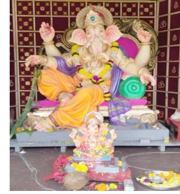
સાર્વજનિક વિજય મંડળ મોગરાવાડી