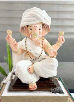
વલસાડ પાલીહિલ રોડ