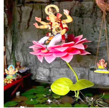
તિરંગા ચોક હનુમાન ભાગડા