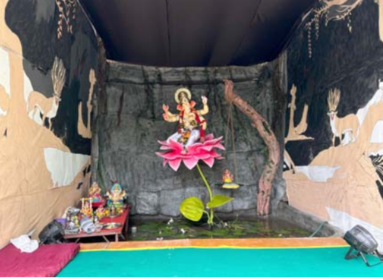
હનુમાન ભાગડા તિરંગા ચોક