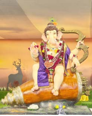
સાર્વજનિક ગણેશ મહોત્સવ તેપાર કોસંબા