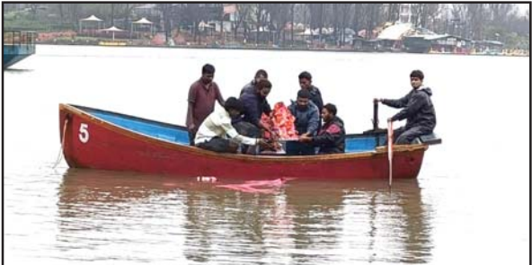
ગિરિમથક સાપુતારાનાં સાંઈ મંદિર ખાતે ભક્તોએ શ્રીજી વિઘ્નહર્તાની પ્રતિમાનું સ્થાપન કર્યું હતું. ત્યારે ભક્તોએ સોમવારે ત્રીજા દિવસે અશ્રુભીની આંખે વિઘ્નહર્તાને વિદાય આપી વિસર્જન કર્યું હતું. સોમવારે સાપુતારાના સર્પ ગંગા તળાવમાં વિધિવત રીતે વિસર્જન કરવામાં આવ્યું હતું.