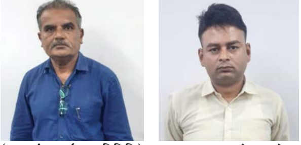
(દમણગંગા ટાઇમ્સ પ્રતિનિધિ) વાપી,તા.૦૯: વલસાડ જિલ્લાના વાપી ખાતે ગુજન