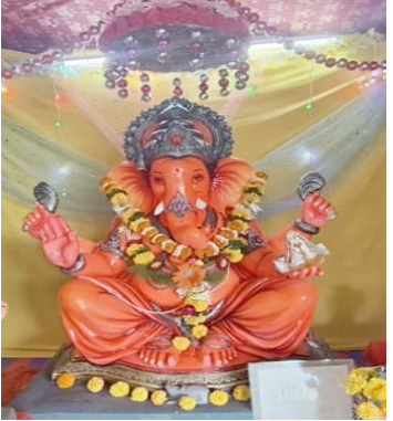
ઓમ રેસિડેન્સી કૈલાસ રોડ