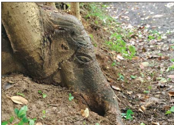
ગણદેવી તાલુકાનાં ઊંડાચ ગામે રાઘવ ફળિયામાં કેશર માતાજીની બાજુમાં જંગલી ઝાડના મૂળિયા પર આબેહુલ ગણેશજીની છબી દેખાતા ભક્તો ભાવુક થયા હતાં. ગણપતિ બાપ્પાની સુંદ અને કાનનો આકાર પણ જોવાયો હતો. શ્રીજીની પ્રતિકૃતિ જોવા મળતા ભક્તોમાં કુતુહલ સર્જાયું હતું.