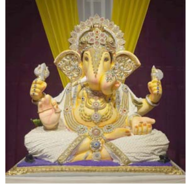
મોટા પારસીવાડ યુવક મિત્ર મંડળ