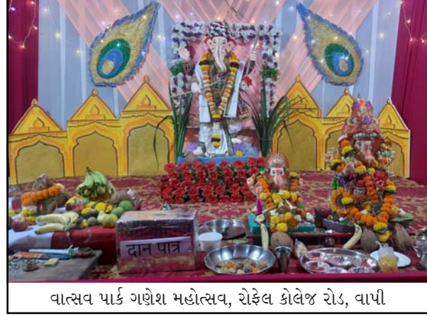
વાલસવ પાર્ક ગણેશ મહોત્સવ, રોકેલ કોલેજ રોડ, વાપી