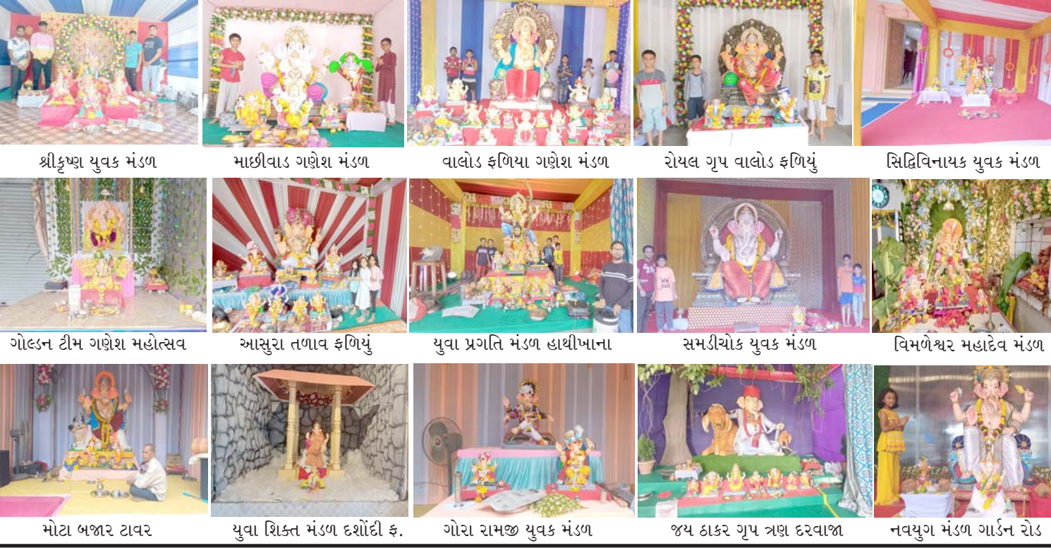
શ્રીકૃષ્ણ યુવક મંડળ, માછીવાડ ગણેશ મંડળ, વાલોડ ફળિયા ગણેશ મંડળ, રોયલ ગૃપ વાલોડ ફળિયા, સિદ્ધિવિનાયક યુવક મંડળ, ગોલડન ટીમ ગણેશ મહોત્સવ, આસુરા તળાવ ફળિયા, યુવા પ્રગતિ મંડળ હાથીખાના, સમીટીયોક યુવક મંડળ, વિમળેશ્વર મહાદેવ મંડળ, મોટા બજાર ટાવર, યુવા શિક્ત મંડળ દશોદી ફ, ગોરા રામજી યુવક મંડળ, જય ઠાકર ગૃપ ત્રણ દરવાજા, નવયુગ મંડળ ગાર્ડન રોડ