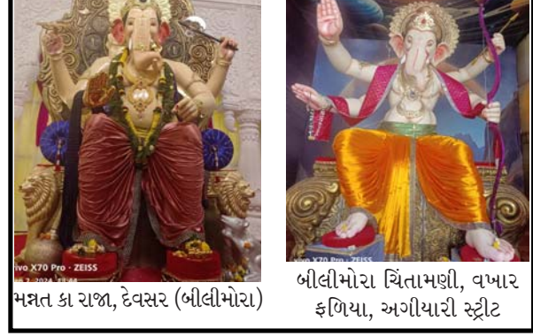
દેવસરના રાજા (બીલીમોરા)