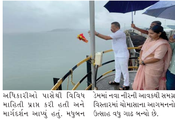
આધિકારીઓ પાસેથી વિવિધ ઉત્સાહ વધુ ગાઢ બન્યો છે.

(દમણગંગા ટાઈમ્સ પ્રતિનિધિ) શીવલ તા.૦૭ : દમણગંગા જળાશય યોજના હેઠળ આવેલા મધુબન ડેમમાં નવા નીરની આવક શરૂ થતાં આનંદનો માહોલ સર્જાયો છે. આ અવસરે કપરાડા વિધાનસભાના ધારાસભ્ય જીવનભરે મધુબન ડેમ ખાતે નવા નીરના વધામણાં કરી પ્રકૃતિપ્રત્યે કૃતજ્ઞતા વ્યક્ત કરી હતી. ધારાસભ્યએ મધુબન ડેમના કન્ટ્રોલ રૂમની મુલાકાત પણ લઈ