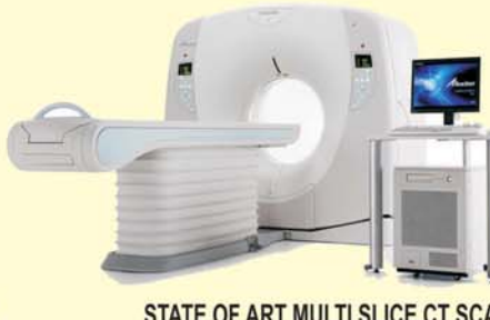
STATE OF ART MULTI SLICE CT SCAN