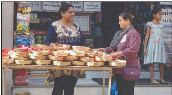
ચીખલી બજારમાં વટ સાવિત્રી નિમિત્તે બહેનોએ પૂજાપો ખરીદવાનું શરૂ કરતાં પૂજાધાનો સામાન ખરીદતી મહિલાઓ જોઈ શકાય છે.