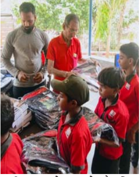
નવી સ્કૂલ બેગ અને શૈક્ષણિક સામગ્રી મળતા વિદ્યાર્થીઓમાં

(દમણગંગા ટાઇમ્સ પ્રતિનિધિ) ધરમપુર, તા. ૧૮ : અમદાવાદ સ્થિત અભિરંગ શ્રી રંગ યુવા સંગઠન દ્વારા કપરાડા તાલુકાના અંતરિયાળ વિસ્તારમાં આવેલી ૬ શાળાઓના ૬૩૦ જરૂરિયાતમંદ વિદ્યાર્થીઓને શૈક્ષણિક કીટનું વિતરણ કરવામાં આવ્યું હતું. કીટમાં નોટબુક, કંપાસ બોક્સ, પેન્સિલ, રબર, સ્કેલ, સ્કૂલ બેગ, ચોકલેટ અને બિસ્કીટ સહિતની સામગ્રી આપવામાં આવી હતી.