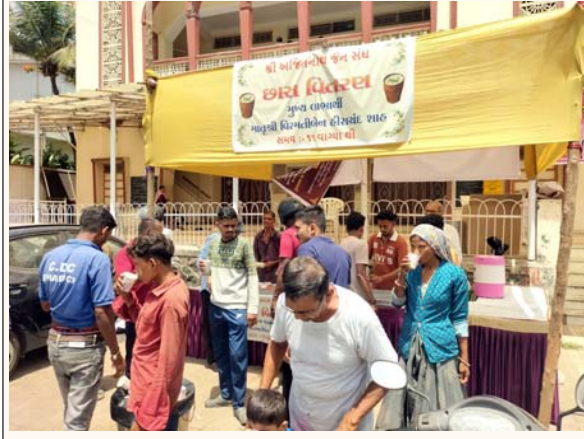
વાપી પંથકમાં છેલ્લા કેટલાક દિવસોથી ભારે ગરમી અને બહારને લઈ લોકોને ગરમીથી બચવા માટે વાપી ટાઉનના શ્રી અજીતનાથ જેન સંઘ દ્વારા મક્ત છાશ વિતરણ કરવામાં આવી રહી છે. જેને લઈ રસ્તે ચાલતા રાહદારીઓને વાહન ચાલકોને ઠંડી છાશ પીવાથી ગરમીથી રાહત થશે. જેકે આ છાશ વિતરણ કાર્યક્રમ રોજ રોજ દાતાઓના સહયોગથી કરાઈ રહ્યો છે.

આનંદની લાગણી જોવા મળી હતી. સંસ્થાના કાર્યકરોએ જણાવ્યું હતું કે જરૂરિયાતમંદ વિદ્યાર્થીઓને શિક્ષણ માટે પ્રોત્સાહન આપવાના હેતુથી આ સેવાકીય કાર્ય હાથ ધરવામાં આવ્યું છે. કાર્યક્રમને સફળ બનાવવા અભિરંગ શ્રી રંગ યુવા સંગઠન, ધરમપુર અભિરંગના સેવાભાવી મિત્રો, સ્થાનિક શાળા પરિવાર તથા CRCનો સહયોગ પ્રાપ્ત થયો હતો.