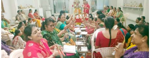
અને આસ્થાથી ઉજવવામાં આવે છે. આ પ્રસંગે પાંચ રંગનો શાસન ધ્વજ ફરકાવવામાં આવ્યો હતો તેમજ નવકાર મહામંત્રના જાપ સાથે ધાર્મિક આરાધના કરવામાં આવી હતી. મહિલા મંડળના સભ્યો તેમજ શ્રાવક-શ્રાવિકાઓએ ઉપવાસ, આચંબિલ, એકાગ્રણા અને પચ્ચખાણ જેવા તપ દ્વારા ધર્મલાભ મેળવ્યો હતો. સમગ્ર કાર્યક્રમ દરમિયાન ભક્તિમય વાતાવરણ છવાયેલું રહ્યું હતું. મંડળના સભ્યોએ જૈન ધર્મના સિદ્ધાંતો અને સંસ્કારોને જનજન સુધી પહોંચાડવાનો સંકલ્પ વ્યક્ત કર્યો હતો.