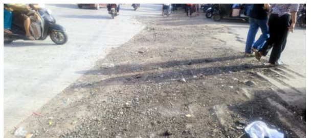
કરવામાં આવ્યું નથી જેમાં ડીએમડીસી હાઈસ્કૂલ બાજુમાં આવેલી મચ્છી માર્કેટ અને ખાવધરી ગલી, પાવર હાઉસથી મદનવાડ તરફ જતો રસ્તા, પાવર હાઉસથી છીપવાડ હનુમાનજી મંદિર તરફ જતો માર્ગ, છીપવાડ સ્માર્ટ બજારની સામેનો રસ્તાઓ પર ખોદકામ કરીને ખાણ તો પૂરી દેવાયા છે, પણ તેના પર ડામરનું પ્રોપર પેચવર્ક ન કરતા વાહનો ફિલપ થઈ રહ્યા છે. ખરાબ રસ્તાના કારણે કારણે રહીશો અને વેપારીઓ ત્રાહિમામ પોકારી ગયા છે. સ્થાનિક રાહદારીઓ અને વાહનચાલકોની માંગ છે કે ચોમાસાનો વિધિવત પ્રારંભ થાય તે પહેલાં જ માર્ગ અને મકાન વિભાગ જાગૃત બને. જો વરસાદ શરૂ થઈ જશે તો આ અધૂરા અને ખોદાયેલા રસ્તાઓ બિસ્માર બની જશે, જેને કારણે અકસ્માતોની હારમાળા સર્જાઈ શકે છે. ચોમાસુ શરૂ થાય તે પહેલા ડામરનું પેચવર્ક કામ પૂરું કરી લોકોને હાલાકીમાંથી મુક્ત અપાવવામાં આવે તે જ સમયની માંગ છે.