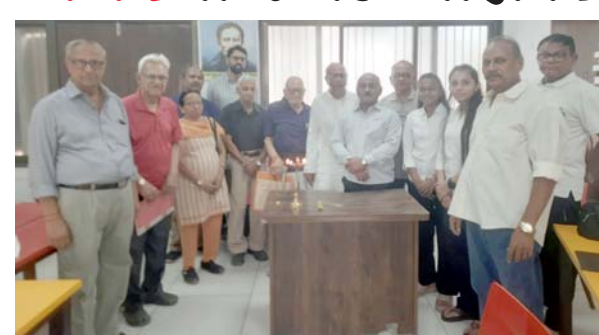
(દમણગંગા ટાઈમ્સ પ્રતિનિધિ) વલસાડ, તા. ૧૫ : પ્રધાનમંત્રી નરેન્દ્ર મોદીના વડાપ્રધાન તરીકેના સફળ જન્મદિવસના ૧૨ વર્ષ પૂર્ણ થવાના અવસરે વલસાડ નગર પાલિકાના વોર્ડ નં.૯ (હાલર વોર્ડ)માં એક વિશેષ જનકલ્યાણ શિબિરનું આયોજન કરવામાં આવ્યું છે. આ શિબિર અંતર્ગત વિસ્તારના નાગરિકો માટે આધારકાર્ડ સંબંધિત કામગીરી તેમજ વડીલો માટે સ્વાસ્થ્ય સુરક્ષા કલ્પ પૂર્ણ પાડતી યોજનાઓનો લાભ આપવામાં આવશે. હાલર નગરપાલિકા વિસ્તારમાં રહેતા જે નાગરિકોને પોતાના આધારકાર્ડમાં સરનામું