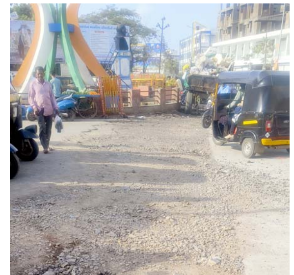
(દમણગંગા ટાઈમ્સ પ્રતિનિધિ) વલસાડ, તા. ૧૫ : વલસાડ શહેરમાં ચોમાસું નજીક આવી રહ્યું છે. ત્યારે માર્ગ અને મકાન વિભાગ દ્વારા અધૂરા છોડાયેલા કામો અને ખોદકામ બાદ રસ્તાઓનું યોગ્ય સમારકામ ન થતાં વાહનચાલકો અને સ્થાનિક રહીશોમાં ભારે રોષ જોવા મળી રહ્યો છે. ચોમાસામાં આ રસ્તાઓ વધુ બિસ્માર બને તે પહેલાં તંત્ર દ્વારા તાકીદે ડામર રોડનું પેચવર્ક કરવામાં આવે તેવી માંગ ઉઠી છે.